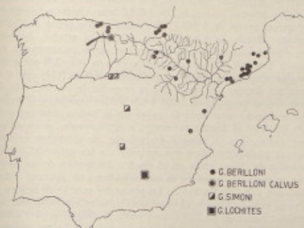
FIG. 2. — Distribución de varios Gammarus de agua dulce en la Península Ibérica. Se ha dibujado el río Ebro y sus afluentes; la flecha señala la localidad de la nueva subespecie de G. berlloni , en la cuenca del Duero.

aconsejable distinguirla como tipo de una subespecie propia. El material se conserva en la Universidad de Barcelona y la descripción se basa sobre machos de 10,5 mm de longitud.